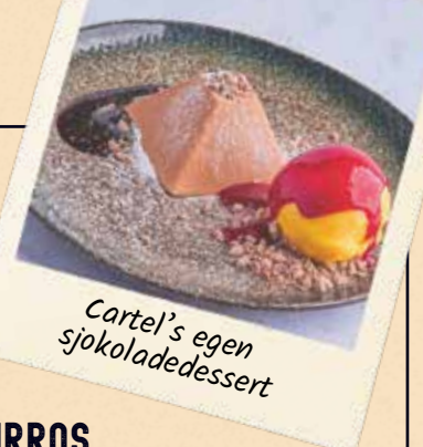
Cartel's egen sjokoladedessert

Disse er så gode at de kan endre ditt liv & gjøre deg avhengig... Vår kjøkkensjef lager selv denne fyldige & mektige ostekaken ispedd en solid dose hvit sjokolade, ruller den så til kuler & dypper kulene i kjekskrumler... Serveres med bringebær coulis & øverste knapp oppkneppet som standard! (Mi, Wg) 169.-